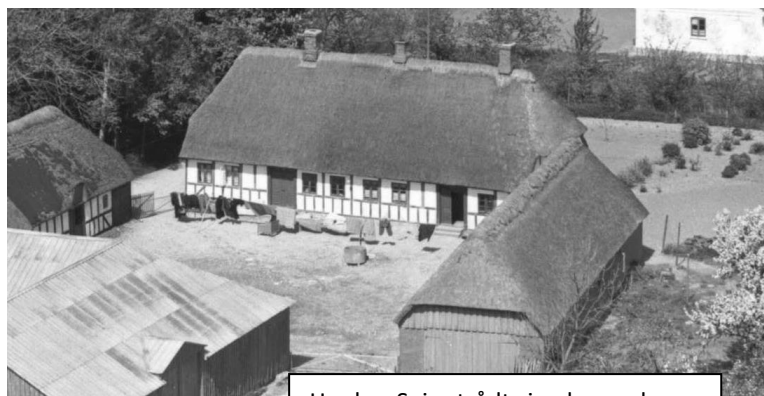
Her har Sejer trådt sine barnesko...