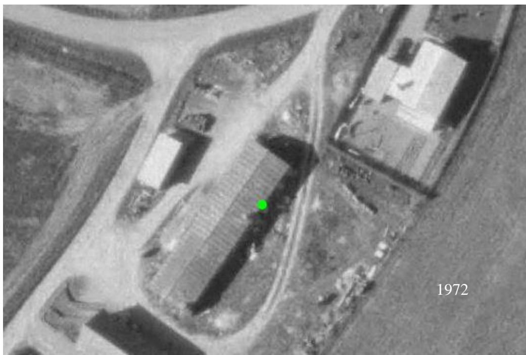
Bottrup Cementstøberi Bottrupvej 51