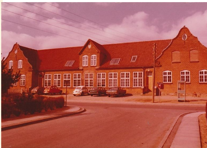
Et billede af Ølsted Skole.

Billedet fik jeg i et telegram, til min konfirmation i 1977 fra alle lærerne.