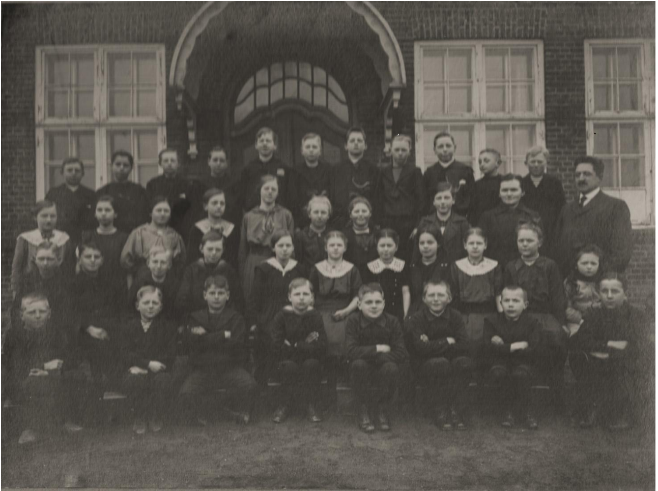
Bagpå dette billede er der skrevet "ca. 1920". Hvis nogen kan fastslå den nøjagtige årgang er man meget velkommen til at kontakte en af personerne i arbejdsgruppen bag Ølsted's Historie.