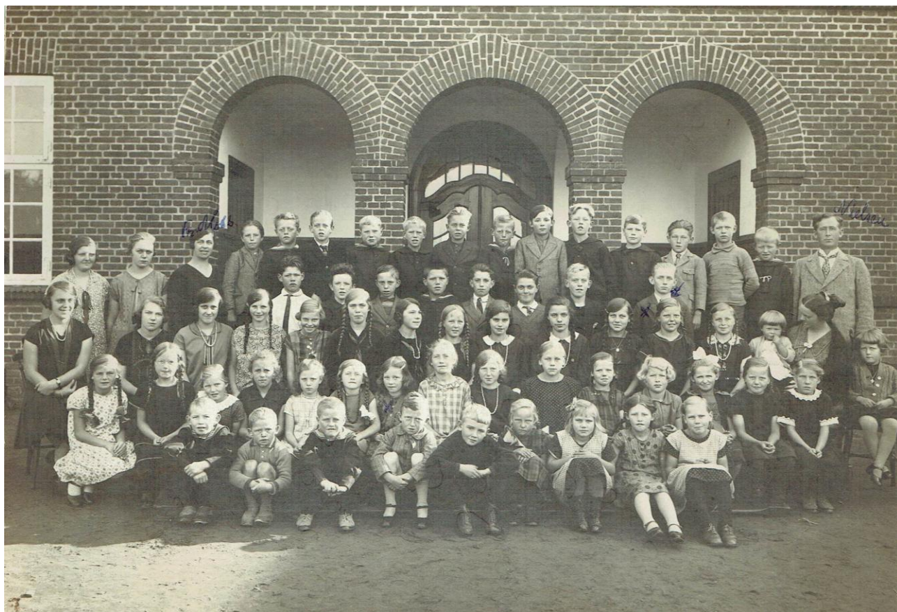
Dette billede er fra 1928