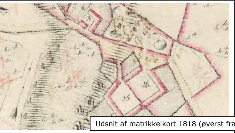
Udsnit af matrikelkort 1818 (øverst fra 1848)

Fundatsen til Ølsted Skole blev approberet og underskrevet af alle Sognets Lodsejere i Aaret 1742. Lodsejerne i Ølsted Sogn udgjorde kun 8, og af dem var som nævnt Bygholm langt den største. I Ølsted By laa 20 Fæstegaarde og 6 Huse, deraf ejede Bygholm 17 Gaarde og 5 Huse, Palsgaard 2 Gaarde, 1 Hus og Tirsbæk 1 Gaard. Af Botterups 9 Gaarde, 3 Huse, samt Kirkejorden havde Bygholm 5 Gaarde og 1 Hus, Horsens Hospital 1 Gaard, Agersbøl 1 Gaard, Ussinggaard 1 Gaard, og N. Munck i Horsens havde Kirkejorden og 1 Hus, det tredje Hus tilhørte Byen. I Oens var der 9 Gaarde og 3 Huse, Bygholm havde 5 Gaarde og 2 Huse, Boller 4 Gaarde og 1 Hus, Kirken tilhørte Etatsraad Lichtenberg i Horsens. Udskiftningen af Ølsted Sogns Jorder fandt Sted i Aarene 1770—1773.